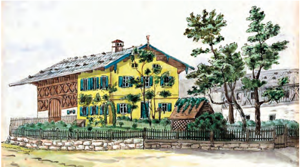
Das „Curatbenefiziantenhaus“, der Pfarrhof um 1858 1