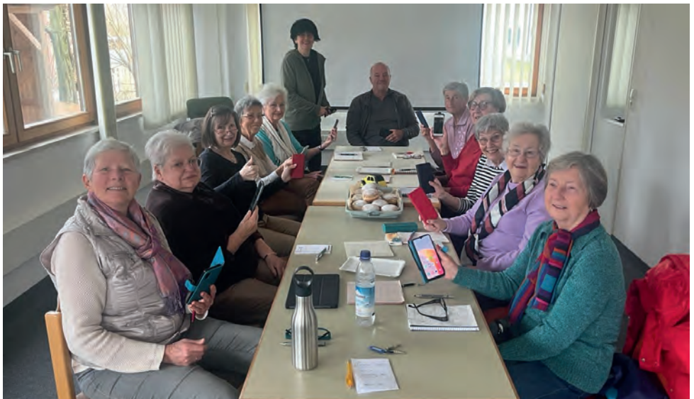
Smartphone-Sprechstunde in der Gemeindebücherei

Dies wurde auch durch neu angebotene Vorträge und Sprechstunden für Senioren zum Thema Smartphone und Trickbetrug erreicht. Diese Idee entstand, um Senioren bei der immer fortschreitenden Digitalisierung zur Seite zu stehen.